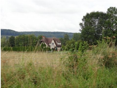
Les champs environnants

Les avis seront cohérents avec ceux émis ces dernières années, à savoir : pas de maisons à volume compliqué (type V, W, Y, ou Z), pentes à 45° pour les volumes principaux, ardoise ou tuile plate de teinte brun vieilli, à 20u/m 2 , avec un débord de toiture de 20cm, enduit de teinte beige clair avec modénatures (au choix : chaînages, encadrement de fenêtres, soubassement, colombage...). *Voir les autres fiches.