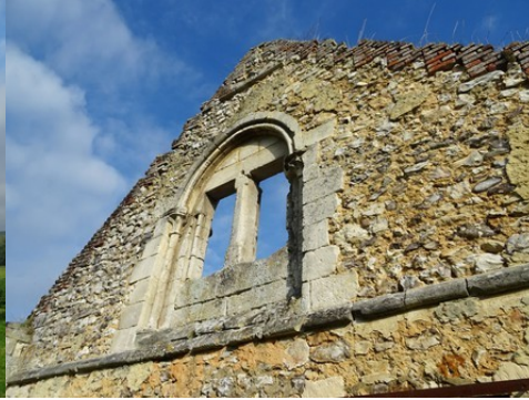
Une baie géminée et ouvragée