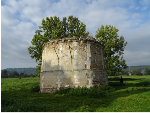
Le colombier circulaire