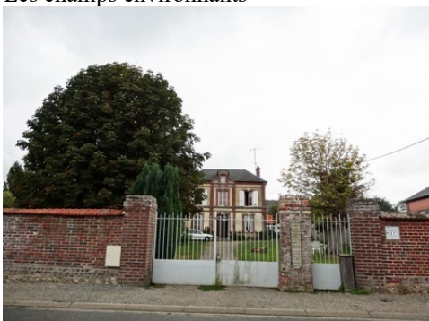
Quelques maisons dans les abords