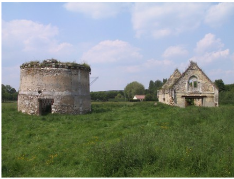
Le logis et le colombier