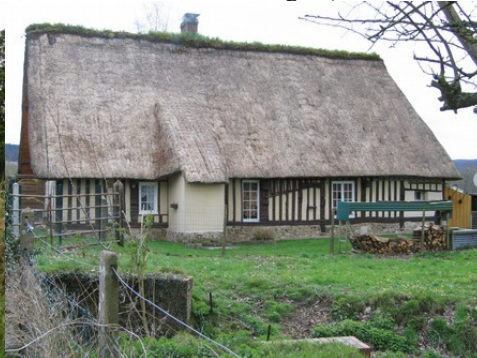
Des exemples d'architecture rurale