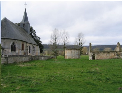
L'église et les vestiges du manoir