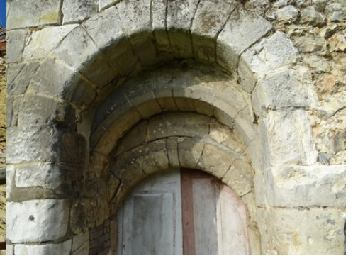
Les arcs de la porte du cellier

Pour la zone en rose foncé dans le périmètre de 500m